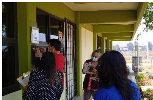
Recorridos del Comité de quejas y/o sugerencias